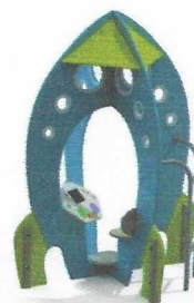
МФ 4.23 Столик