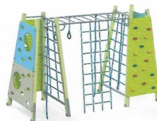
СО 4.062 Спортивное оборудование