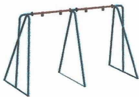
ДИО 1.022 Качели стандарт двойные