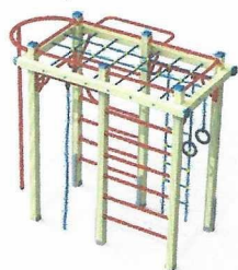
СО 1.30 Спортивный комплекс Шведская стенка с шестом