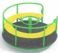
ДИО 2.08 Карусель со сплошным сидением