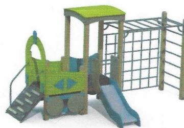
МФ 4.053 Паровоз с рукоходом и горкой