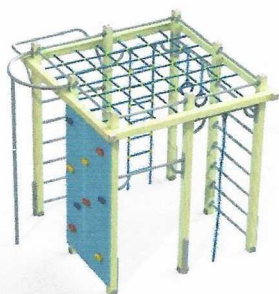
СО 1.12 Спортивный комплекс с сетью