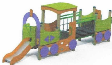
МФ 4.04 Паровоз с 1 вагоном и горкой Н=700 мм