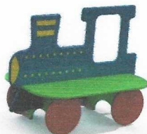
МФ 1.201 Лавочка со спинкой Паровозик