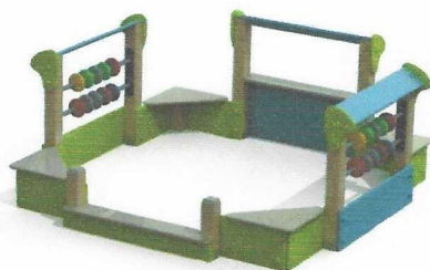
МФ 3.112 Песочница со счетами