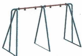
ДИО 1.022 Качели стандарт двойные