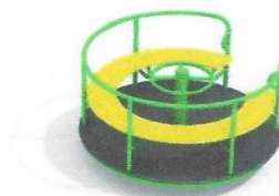
ДИО 2.08 Карусель со сплошным сидением