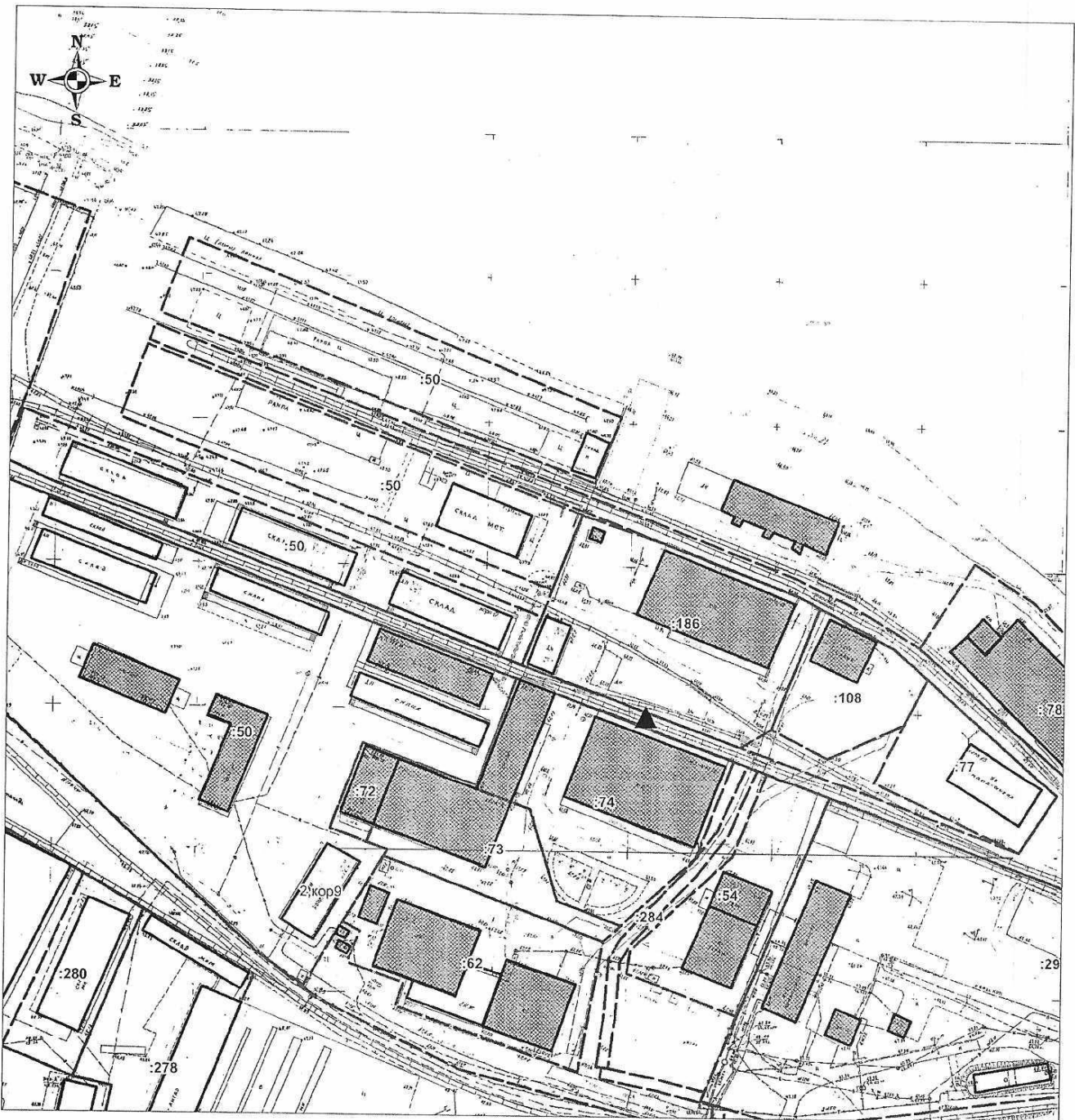
Схема размещения мест (площадок) накопления твердых коммунальных отходов на территории городского округа "Котлас" ул. Новая Ветка, 3 корп. 16 Масштаб 1:2000

▲ - места накопления твердых коммунальных отходов городского округа "Котлас"