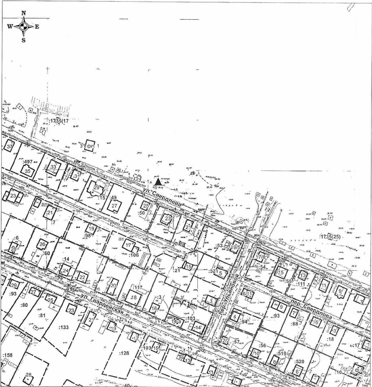
Схема размещения мест (площадок) накопления твердых коммунальных отходов на территории городского округа "Котлас" ул. Свердлова, 25 Масштаб 1:2000

▲ - места накопления твердых коммунальных отходов городского округа "Котлас"